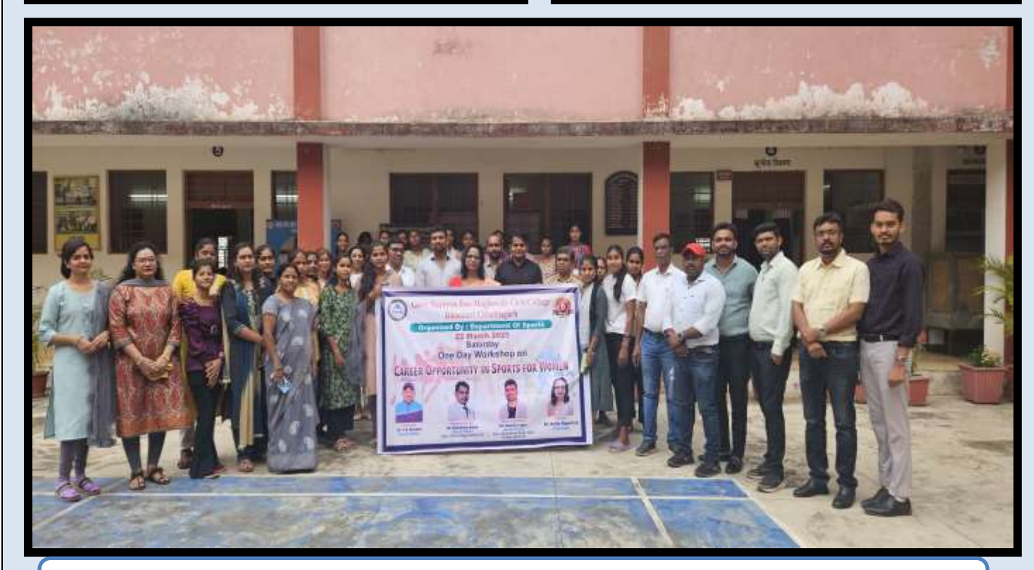
Govt. Narayan Rao Meghawale Girls College Dhamtari (C.G.)